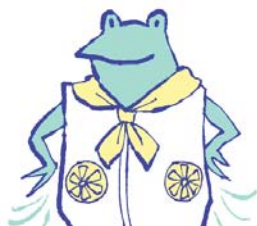
ファン付きウェア、 ネッククーラー